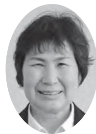
井 芳 美 員 井 議

〔答〕職員の配置については、私もぜひそうしたいと考えているが本年度4名の採用通知を出したが1名しか入庁しなかった状況である。また、本年度3名の職員が退庁されるため、内部にて、十分検討したい。