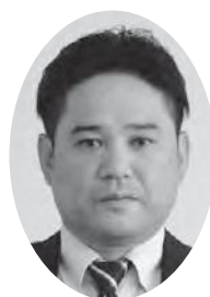
西村 直樹 議員

始業点検については、事故やキズ等の確認だけを行っている状況である。公用車の管理については、副安全管理者の設置等も含めて再度課長会議等を行い徹底し、議員から助言のあったことも含めて今後公用車の安全管理に努めたい。