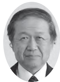
渡辺 裕文 議員