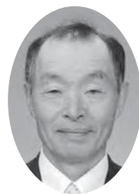
岩 下 徳 員 岩 下 議