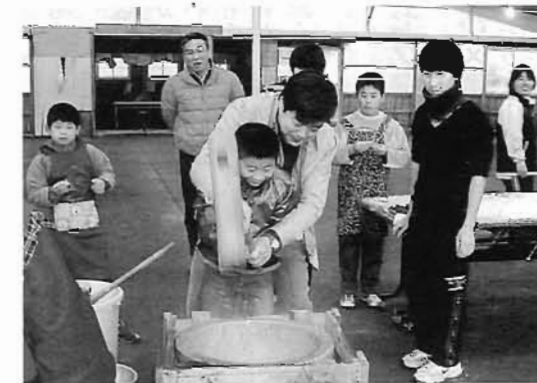
一生懸命に餅をつきました