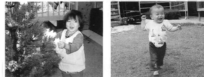
子ども達の笑顔って、まわりの大人もしあわせになりますね！