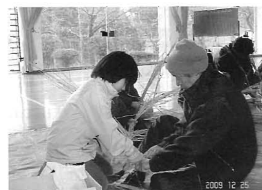
しめ縄の編み方を教わりました