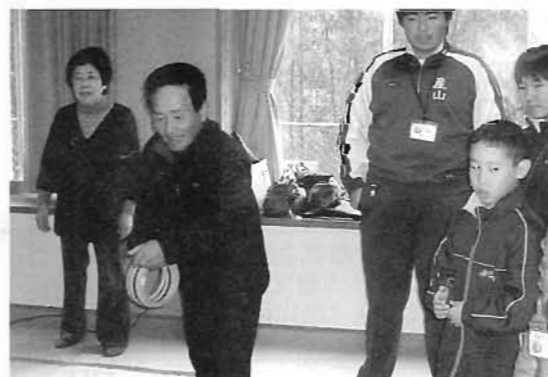
公民館では、ゲームやお喋りを楽しみました。