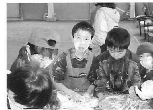
真っ白になりながら餅を丸めました