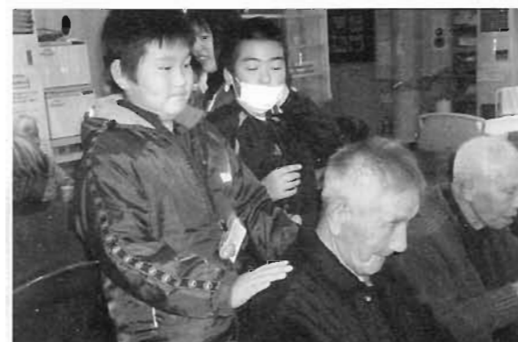
子どもヘルパーならではの肩もみで心のこもったサービスです。

1月25日(月曜)、今年度最後となる「子ども・ジュニアヘルパー活動」を実施しました。今回は、地区公民館や福祉施設(ほっと館・なでしこの里)において高齢者と交流を深める目的で、ゲームや手芸を高齢者と一緒に行い親睦を図りました。また、福祉施設では、利用者へのお茶出しや肩もみなどを行い、短い時間でしたが、会場は笑顔や笑い声に溢れ今年度を締めくくる楽しい子どもヘルパー活動となりました。