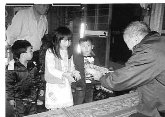
子ども達から、つきたてのお餅が届けられました

つきあがった餅は、子ども達から村内の一人暮らしの高齢者に届けられ、皆さんに喜んでいただきました。