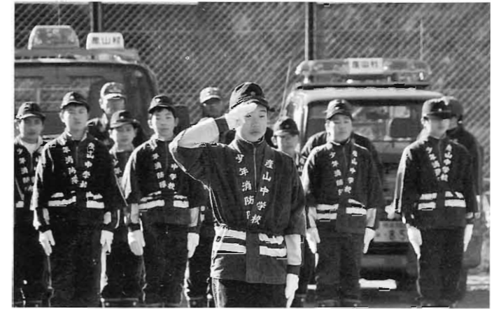
見事な規律を披露した少年消防隊

通常点検では、厳寒の中各分団、少年消防隊により気合いの入った見事な規律が披露され、第3分団が優勝を飾りました。また、各分団による一斉放水ではカラフルな水のアーチが大空に浮かびました。