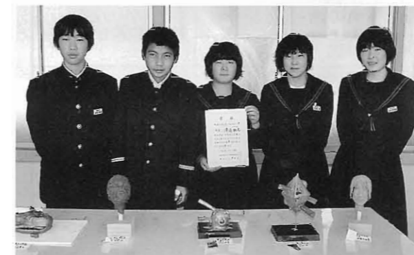
子ども美術展入賞者（上段）と 作品展入賞者（下段）のみなさん