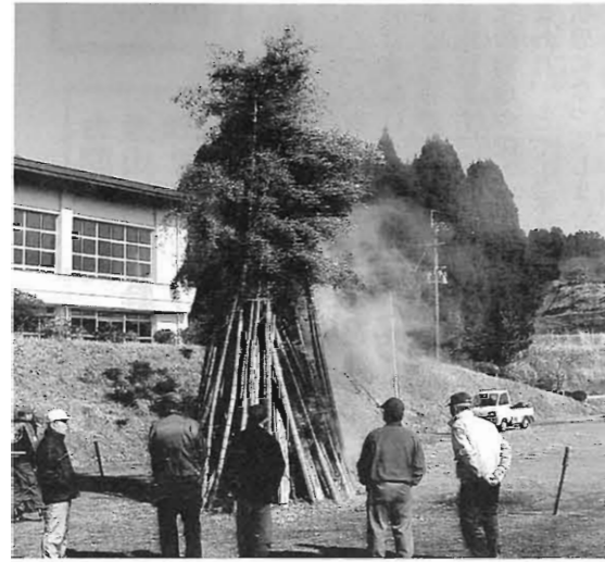
燃えあがる炎に無病息災を願いました

阿蘇消防署波野・産山分駐署署長以下4名により、公民館和室において、大人28名の参加で実施して頂きました。署長の全般説明後、男女に分かれ署員の展示及び署員の指導の下実習を行いました。講義内容は、心肺蘇生法（気道確保、呼吸吹き込み法、心臓マッサージ法AEDS使用法）、傷病者搬送法のどに物を詰まらせ呼吸困難者の救助法、マムシ・蜂による受症時の対処法でした。参加者ほとんどが初めての受講とあって真剣に受講しました。心肺蘇生法では、参加者全員が体験し体得したのと思えます。マムシに咬まれたり蜂に刺された場合は、毒が回らないように止血して早急に