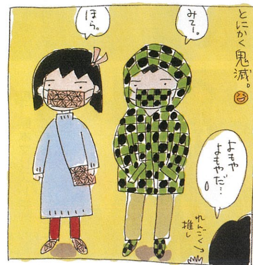
竹型マスクとかはまだ見ないなあ。