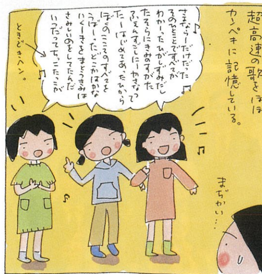
その勢いでかけざんも覚えてワグサイ〜。