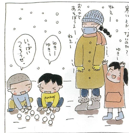
脂肪はこっちの方が多いのに。

子どものものさしは、面白いかつまんないか。おいしいかまずいか。 いいにおいかイヤなおいか。怒るひとか怒らない人か。 自由が好き。片付けはイヤだけど、キレイな部屋は好き。手触りのいいものが好き。 そういうのが善悪よりちよびっと優先しちゃう。あ、オトナも一緒だった。