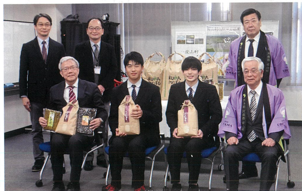
熊本高等専門学校

食べる機会がなかったため、今日は久しぶりに村のお米を食べて、産山を思い出しました。おいしいお米を食べて、これからも勉強を頑張ります。」と、村への感謝の気持ちと抱負を語ってくれました。 また、今回の2校以外にも、村出身で寮生活