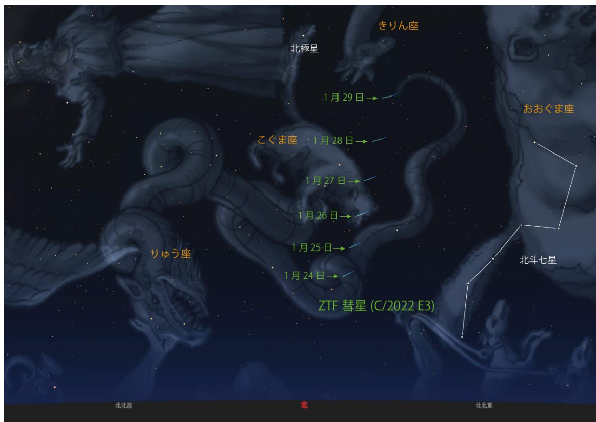
1月下旬のZTF彗星の位置(19時頃)