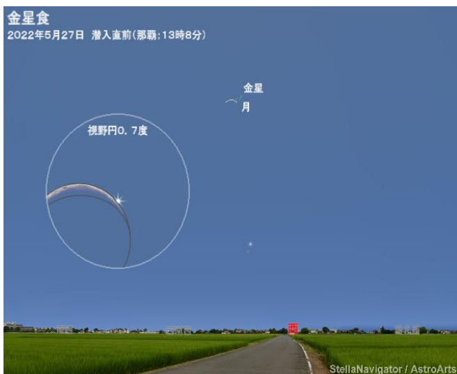
2022年5月27日の金星の 見え方（沖縄）