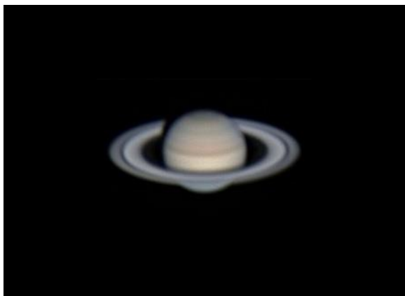
最近の環の傾きが緩やかになった土星