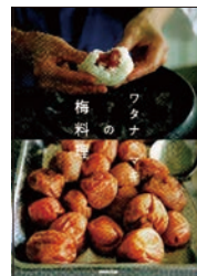
ワタナヘマキの梅料理 ワタナヘマキ・著 NTK出版