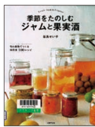
季節をたのしむジャムと果実酒 谷島せいいち・著 成美堂出版