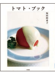
トマト・ブック 坂田阿希子・著 東京書籍