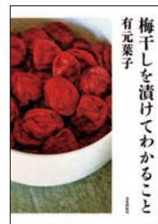
梅干しを漬けてわかること 有元葉子・著 文化出版局