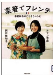
菜箸でフレンチ 阿川佳和子・タナカ麻美・著 マガジンハウス