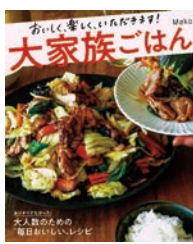
大家族ごはん Makino・著 成美堂出版