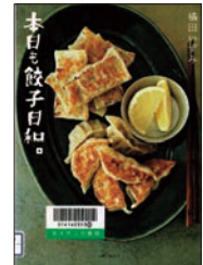
本日も餃子日和 橋田いずみ・著 主婦と生活社