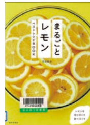
まるごとレモン 河井美歩・著 家の光協会