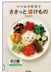
いつもの野菜で ささっと漬けもの 村島直美・著 家の光協会