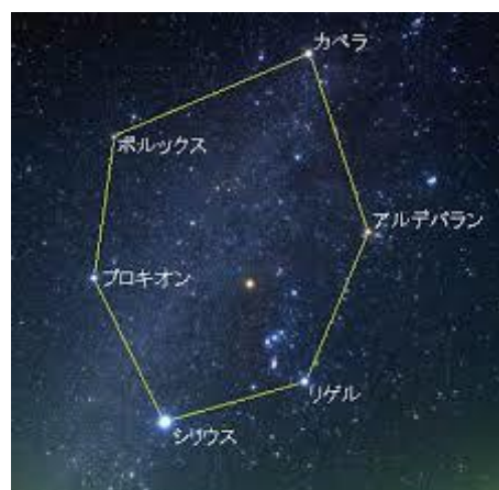
冬のダイヤモンド