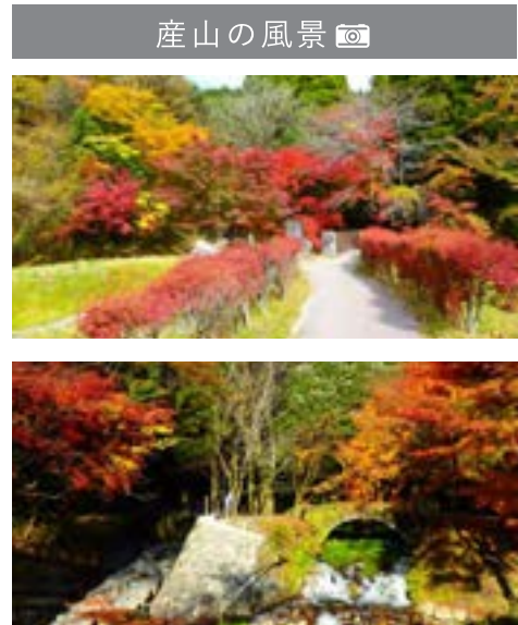
紅葉の季節になりました！※昨年度撮影