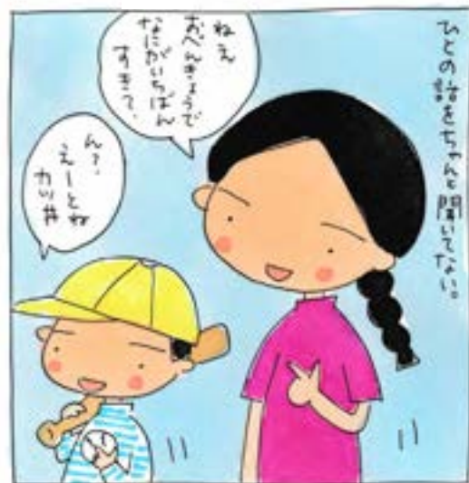
あとね、ハンバーグ。