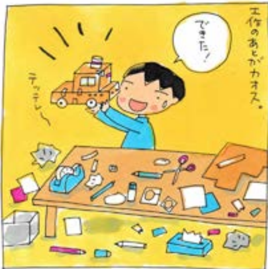
目的に向かって一直線。

ダメ!って言うておけば事件は起こらない けがもしないし、モノもこわれなく でも子どもはいつだって、やってみたい あぶないこと。きたないこと。もったいないこと。 だったらそれ、たまには大人もいっしょにやってみようかな。