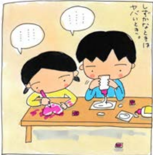
気づいたときはすでに遅し。