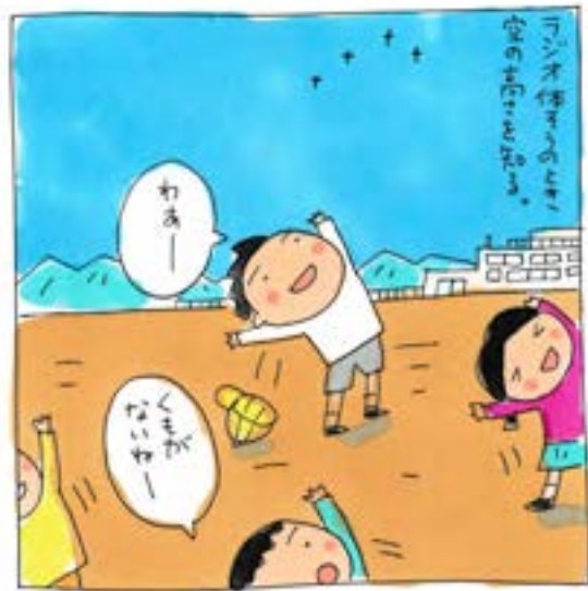
うぶやまで良かった。