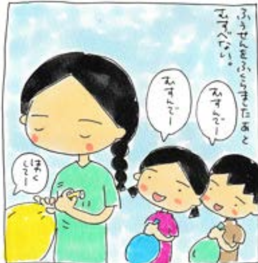
3年生くらいから結べるようになる。