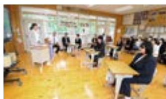
思い出のホームルーム

基 幹集落センターにおいて「二十歳のつどい」が開催され、産山学園第1期生として卒業した7名が参加しました。