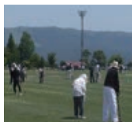
グラウンド・ゴルフ大会