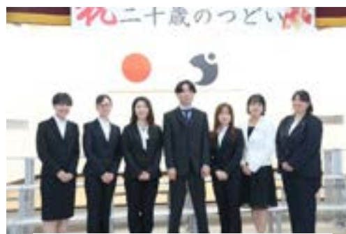
産山村二十歳のつどい R5.8.15

自分の生き方の土台となっている「ふるさと」や、これまでつながってきた多くの人々。さらには、「あたりまえ」のように存在する自分を取り巻く日常を改めて見つめ直すことは、大変意味のあることだと感じました。また、自分の考えや感謝の気持ちを素直に表現しあえる温かな人間関係の大切さも感じました。