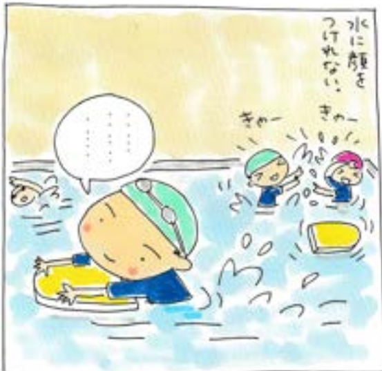
お風呂でちょっとずつ練習しようっと。