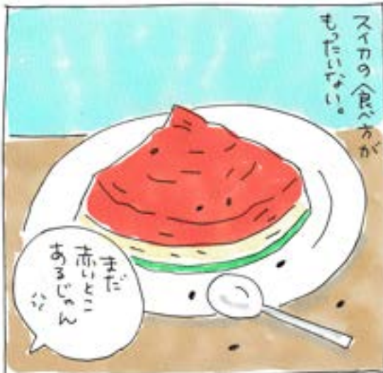
カブトムシの分を残したんだもん。

いまわたしはすごくおこっているんだ。 だからぜったい笑わない。なにがあっても笑わない。 こちょこちょもきかない。変顔もおもしろくない。 アイスもいらない。ぜんぜんいらな〜い。 (みんながいなくなってから、ひとりで食べるんだもん。)