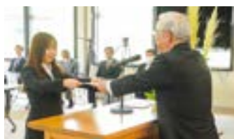
ふるさと特使任命の様子