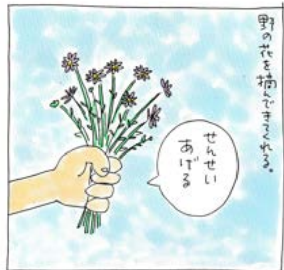
あなどれないきれいさ。