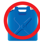
灯油ポリエチレン缶