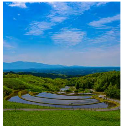
田植え中の扇棚田