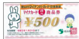
マイナカード還元商品券