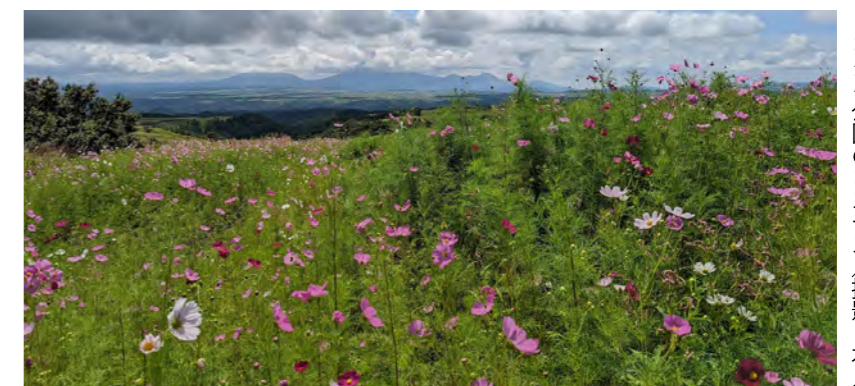
ヒゴタイ公園のコスモス