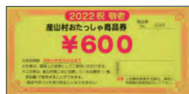
おたっしや券 (※なでしこの里は除く)