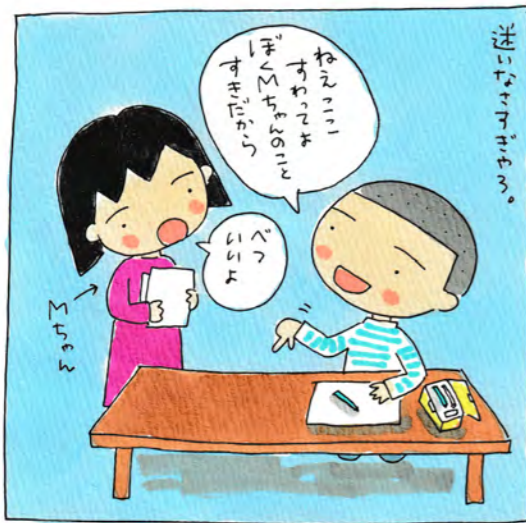
成就したのか？してないのか？