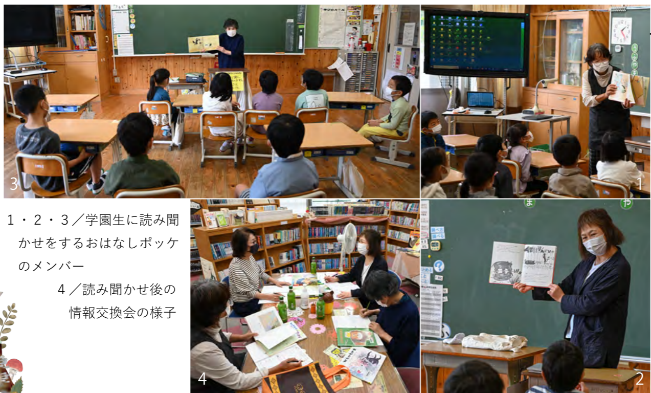
1・2・3 / 学園生に読み聞かせをするおはなしポケットのメンバー 4 / 読み聞かせ後の情報交換会の様子