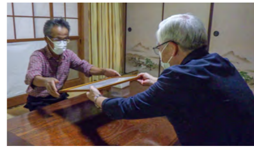
井テルミ様：代理/慶光様

これは敬老の日の記念行事として、今年度百歳を迎えられる高齢者の方々の長寿を祝い、多年にわたり社会の発展に寄与してきたことに敬意を表し、広く高齢者の福祉についての関心と理解を深めることを目的に国が実施しているもので、併せて村からも日頃の感謝を込めて行われたものです。