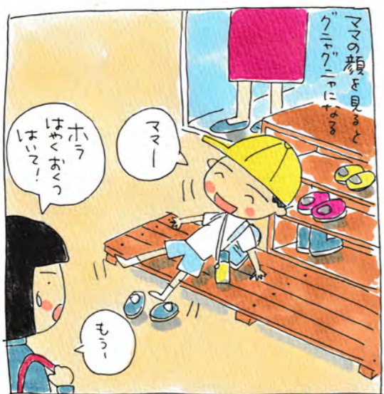
今日もいちにちがんばった。