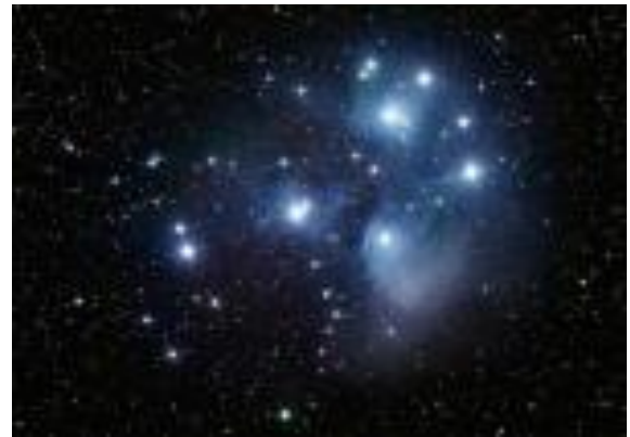
M45 プレアデス星団 (スバル)