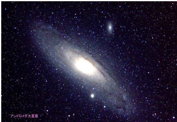
アンドロメダ銀河 (M31)