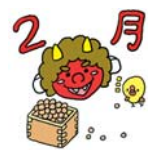
【カルタ取り】 【小学校体験入学】