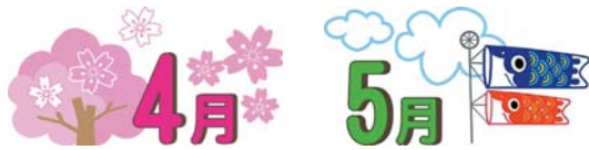
【入園式】 【親子歓迎遠足】