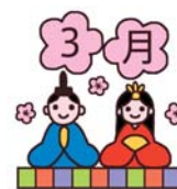
【お別れ遠足】 【卒園式】