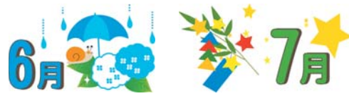
【保育参観】【プール開き】 【夕涼み会】