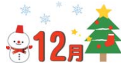
【クリスマス会】 【餅つき】