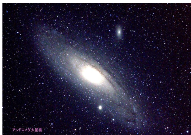
M31 アンドロメダ銀河