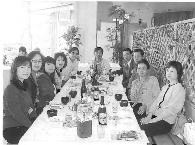
昨年の在熊産山村人会

知らない人が多くなってきたのだと、そこで誠に勝手なお願いですが、産山村在住の方の親類（親子、兄弟、その他）や知り合いに郷里を離れている方が居ましたら、その方に、このような会があることを知らせていただくと共に、その方の「住所