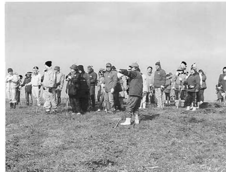
作戦を聞く参加者のみなさん

2月7日、うぶやま牧場周辺の原野において大草原のうさぎ追いが開催されました。今年はおよそ40名の参加、“ちょーいちょーい”のかけ声の下、竹の棒で地面をたたきながら勢子隊が2メートルほどの丈のかやのを分け入り網に向かってうさぎを追いつめました。網にかかった1羽のうさぎに大人も子どもも大興奮のようすでした。