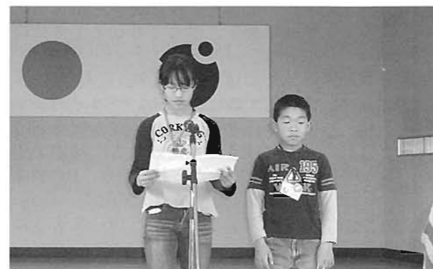
3年間の活動を振り返って感想発表