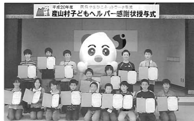
ネットワークキャラクターやまびこ君と記念撮影