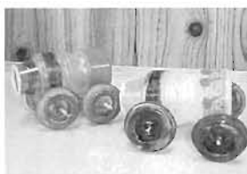
ヤクルトの空容器の車