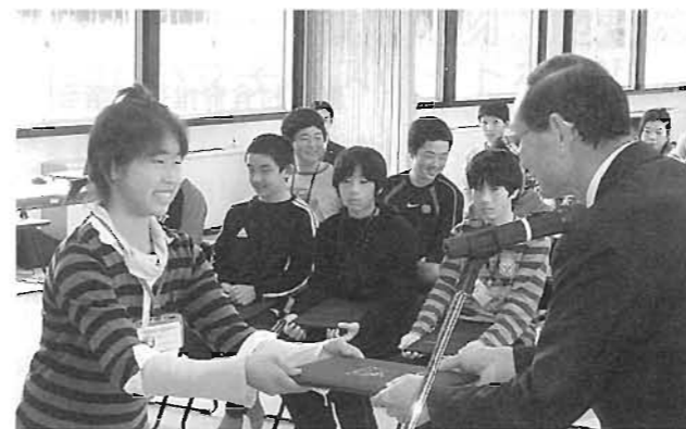
感謝状が一人一人に贈られました