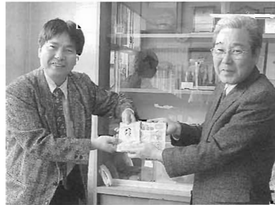
村長へ手帳が贈呈されました

この活動は昭和58年からスタート、全国展開されており行政機関や福祉施設に贈呈されています。今年も本村に20冊が贈呈され住民課の窓口においてあります。この手帳を見かけた際はみなさんのご協力をお願いします。