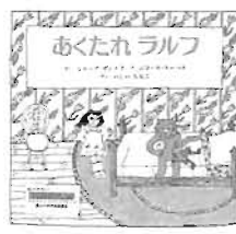
あくたれラルフ 童話館出版

ちょっと不安なことや失敗があっても大丈夫。おとうさんやおかあさん、家族に愛されていること・見守られていることが、こどもの「元気の源」なんです。親子・家族の愛情があふれ、やさしい気持ちになれる本を集めました。