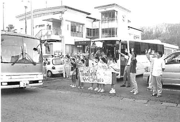
行ってらっしゃ〜い！たくさんの見送りの中、出発！

7月27日、タイ国へ向けて交流生、随行団40名が出発しました。今年はヒゴタイ交流20周年の節目の年であり、翌28日、タイ国で記念式典が開催され、その様子が同時中継されました。タイでの交流を深めた後、随行団は1日、交流生は17日帰国予定です。