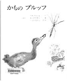
かものプルッフ 童話館出版