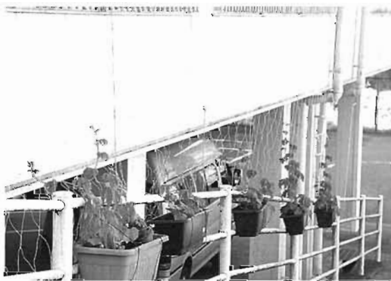
植え付後 1ヶ月 経済建設課