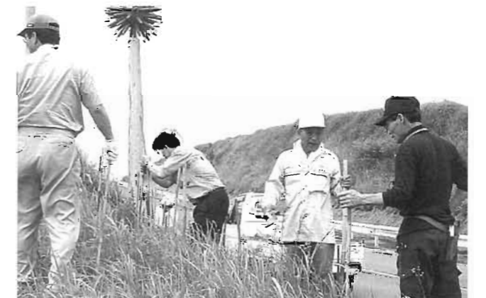
ヒゴタイの支柱たてる会員のみなさん

7月4日、村商工会及び観光協会によりクリーンキャンペーンが行われました。当日は会員25名が参加し、やまなみハイウェイの清掃活動及びヒゴタイロードでヒゴタイの支柱立てが行われました。村の観光振興を目的に毎年行われているこの活動は昨年、小さな親切運動の表彰も受け、地域の美化活動に貢献しています。