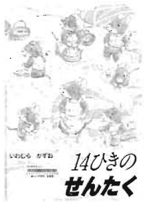
14ひきの せんたく 童心社