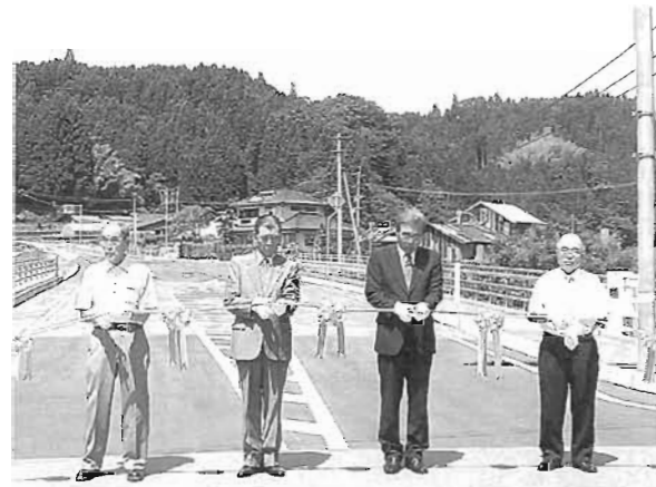
関係者により、テープカットが行われました。