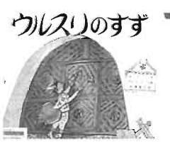
ウルスリのすず 岩波書店