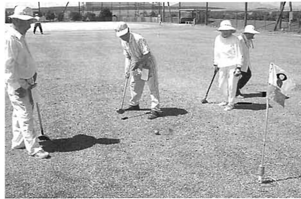
気持ちのよい晴天の中、グランドゴルフを楽しみました

7月16日（水曜）、産山村営グラウンドにおいて、今年で13回目を迎える、産山・波野親善グランドゴルフ大会が開催されました。本大会へ愛好者45名（産山30名・波野15名）が参加し、昔からの友人や顔見知りの方々と一緒にプレーを楽しみました。大会成績は以下のとおりです。（H：ホールインワン）