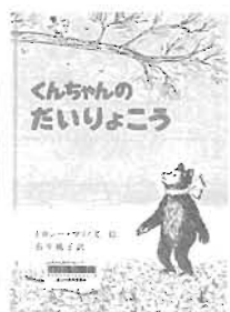
くんちゃんの だいりょこう 岩波書店