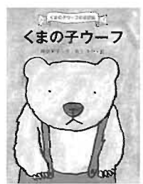
くまの子ウーフ ポプラ社