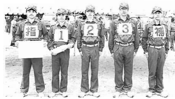
3位入賞、おめでとうございます。