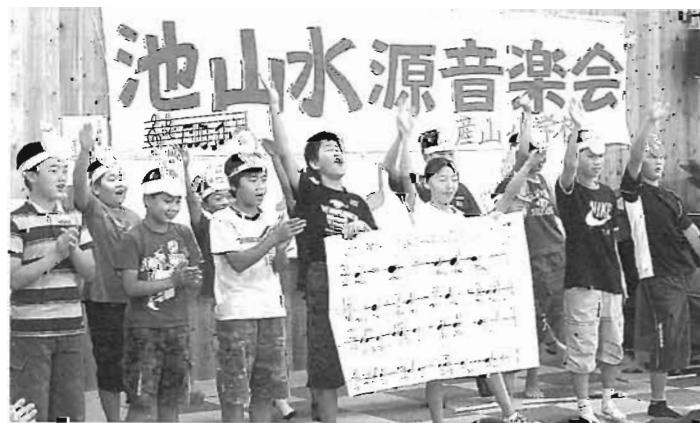
会場をわかせた6年生の発表