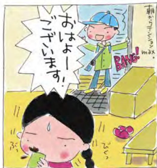
あふれる愛あふれるエネルギー