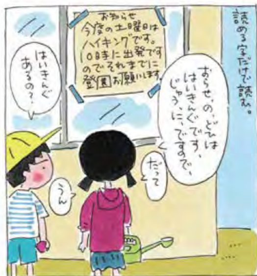
エッセンスだけはわかってる。