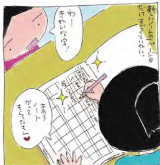
み●先生にもほめられたし。