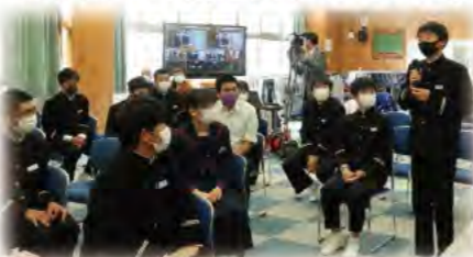
常に話し手を見て、心で受け止めながら聴く学園生の皆さん

そして何より、温かな心のつながりを感じたのは、学園生の姿でした。人権作文発表や講話をしっかりと心で聴き、受け止める姿勢に加え、感想発表の時には、「自分のことと重ねながら、“自分のことば”で」次々と発表する学園生の姿に感動しました。