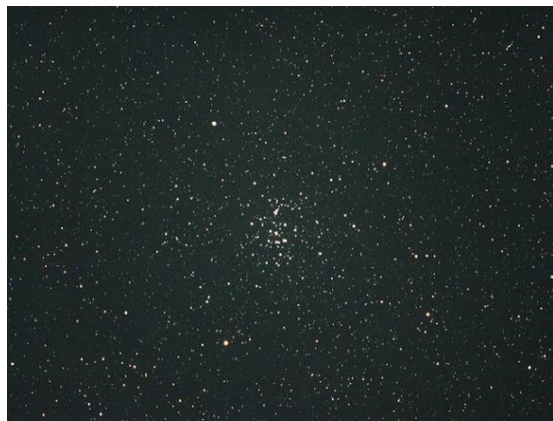
かに座の散開星団 M44(プレセペ)