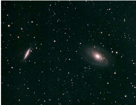
おおぐま座の銀河(M81・M82)