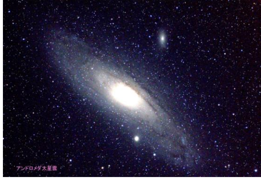
アンドロメダ銀河 (M31)