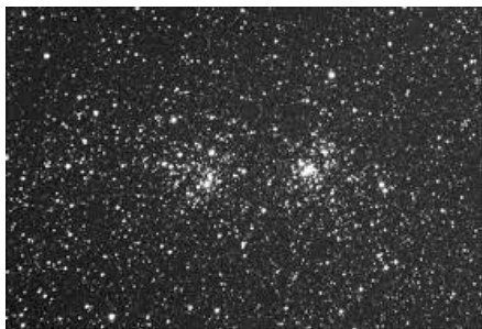
ペルセウス座二重星団 (h と \chi )