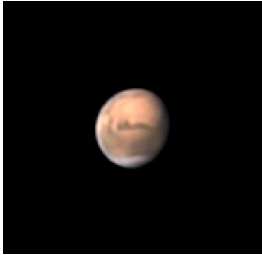
地球から遠ざかる火星