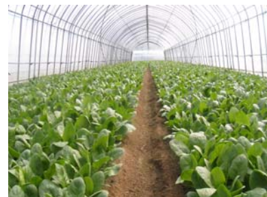
ほうれん草栽培状況